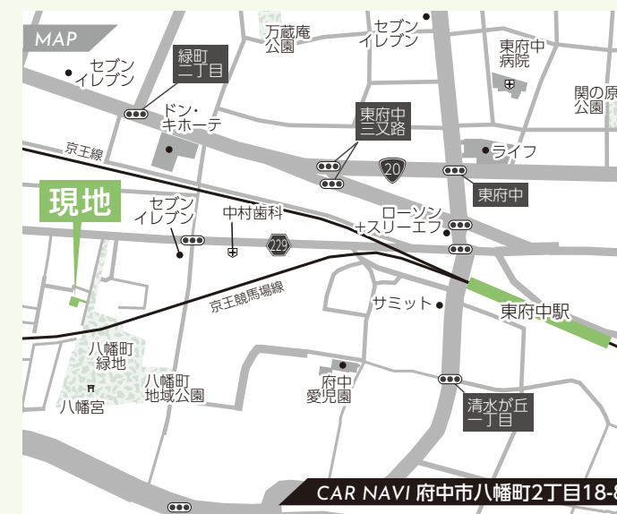
CAR NAVI 府中市八幡町2丁目18-8